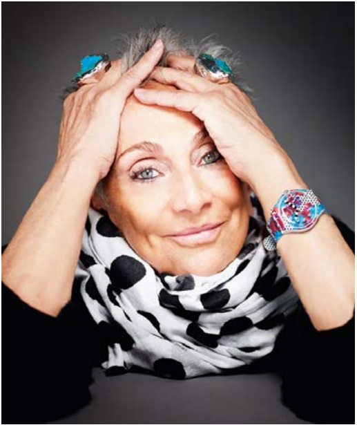
PAOLA NAVONE Architetto, Designer, Art Director, Interior designer