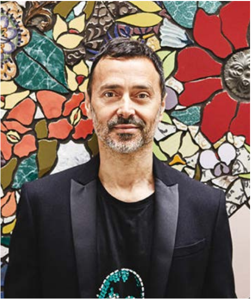
FABIO NOVEMBRE Architetto e Designer